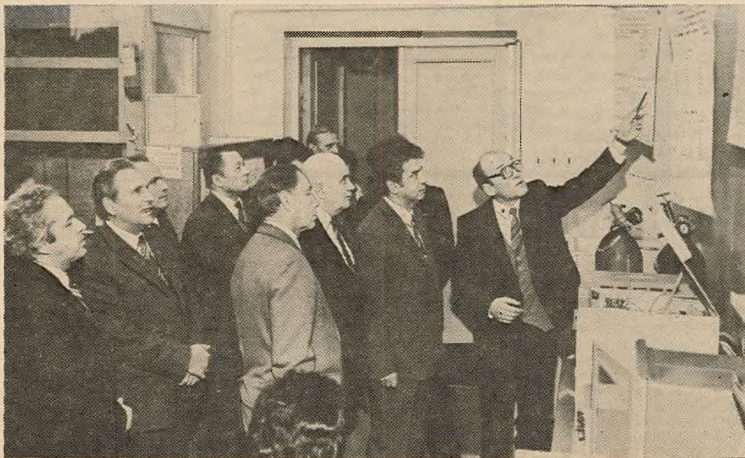
НА ЗДЫМКУ: у час знаёмства з дасягненнямі навукова-даследчага інстытута фізіка-хімічных праблем.